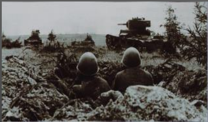
Фото 8. Отражение атаки на Миус-фронте

Дедушка и бабушка многое помнят о своем военном детстве. Иногда они делятся своими горькими воспоминаниями со мной.