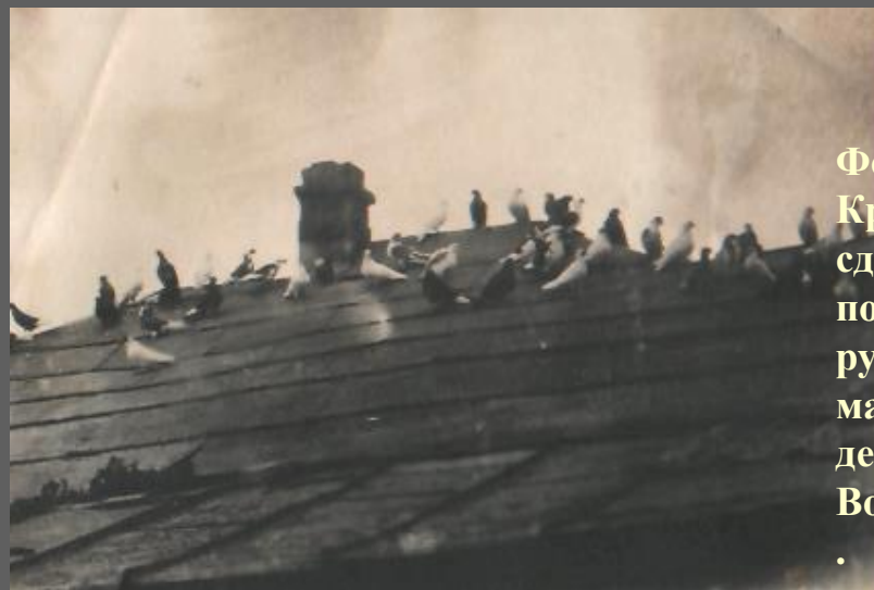
Фото 16. Крыша, сделанная после войны руками матери и детей Волощуковых