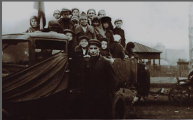
Фото 4. 1930-е годы. У элеватора