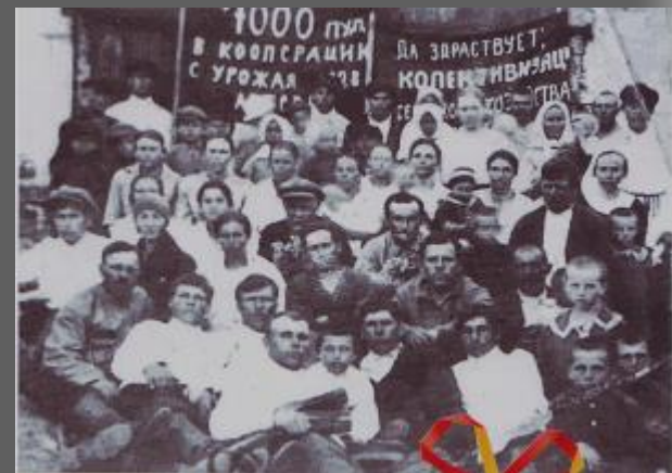
Фото 5. Да здравствует коллективизация!