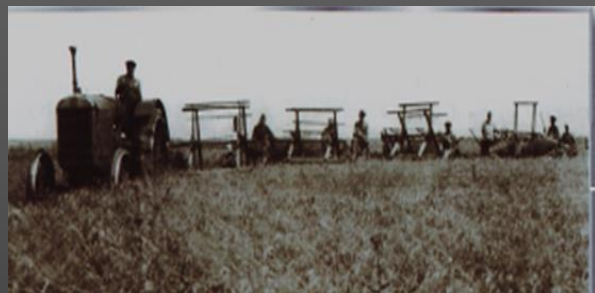
Фото 3. 1930-е годы. Сбор урожая

Из книги Г.К. Пужаева «Годы и люди». Исторические хроники»: «В 1940 году в районе было 35 колхозов и совхозов. Они засевали 57700 гектаров зерновых и масличных культур. С гектара собирали по 12, 5 центнеров зерна. Государству район сдал 1440000 пудов хлеба, 18000 подсолнечника, 60000 пудов овощей, 10810 гектолитров молока, 18600 пудов мяса; на полях района работало 207 тракторов и 76 комбайнов. В колхозах и совхозах имелось 8600 голов крупного скота, 3376 лошадей, 13000 свиней, 12000 овец». Наш район устойчиво развивался. В своей книге Григорий Кириллович описывает и положительные изменения в социальной сфере. Например, к 1941 году работало 38 школ, в которых обучалось 6400 детей. Грамотное население составляло 70%.